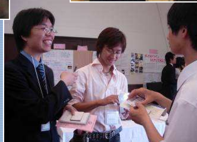
ポスター発表もやりました