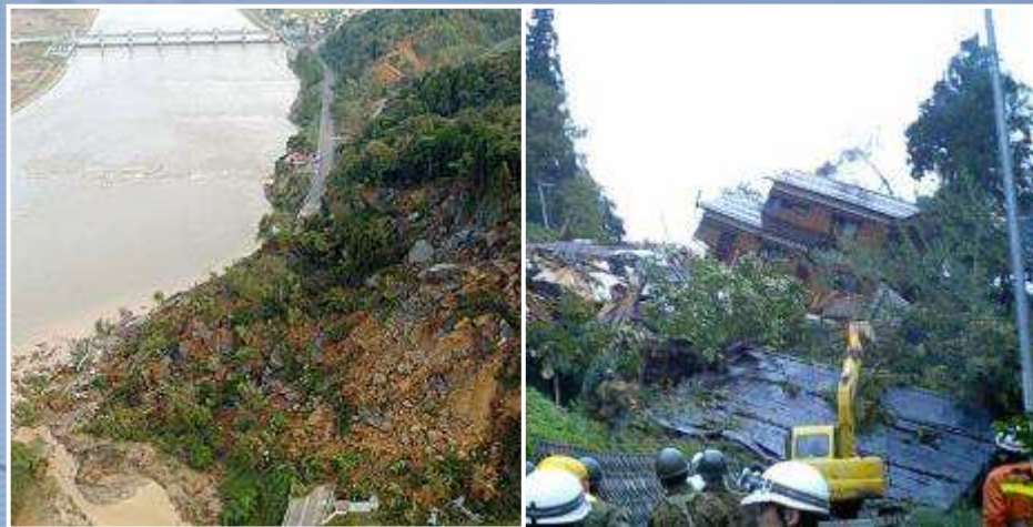
新潟県中越地震の被害