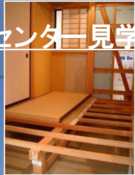
上:木造住宅の耐震補強例 下:津波ドームシアター