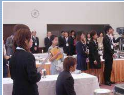
報告会交流パーティーの様子