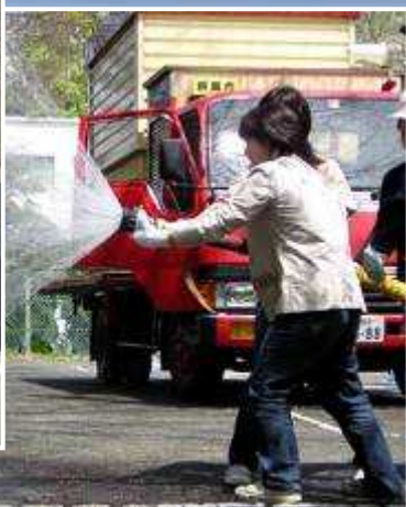
大学生による防災訓練の例