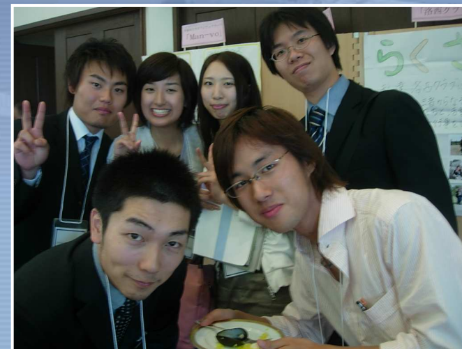
続々と仲間が増えています